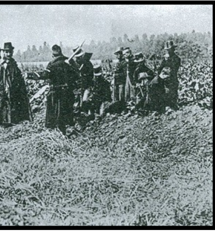
ux durant la guerre 1914-1918