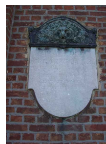
Monument aux morts des deux guerres et plaque commémorative de Borlez , situés Rue Albert ler