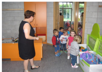
Sortie de classes des maternelles

Durant les vacances, les implantations scolaires ont connu quelques aménagements : nouveau mobilier construit par les ouvriers communaux pour les élèves de maternelles de Celles et peintures toutes fraîches pour certaines classes de Les Waleffes.