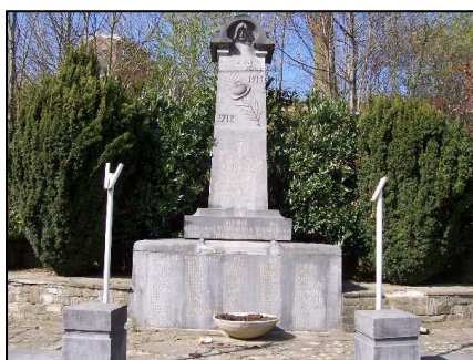
Monument aux morts de Les Waleffes , inauguré le 22 août 1920 en présence du général PONTUS et de Hubert KRAINS (qui a donné son nom à la rue dans laquelle a été érigé le monument).

La vie est terrible aussi pour les enfants qui, affaiblis, souffrent de maladies. Les épidémies de la grippe espagnole et du croup sévissent dans nos villages dès 1917.