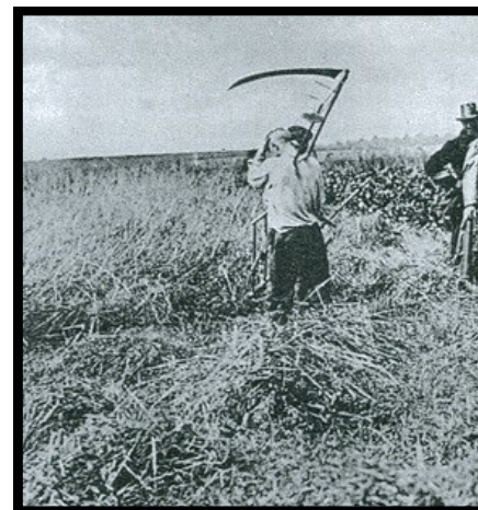
Moissons dans les milieux ruraux

Les gens des villes, poussés par l'épouvantable disette et le chômage affluent vers les campagnes en espérant y trouver plus aisément des vivres.