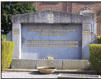
A Viemme, un monument a été érigé Place de la Liberté en hommages aux soldats tombés durant les deux guerres.

Nous avons la chance de vivre en paix. D'autres connaissent la guerre, non loin de chez nous.